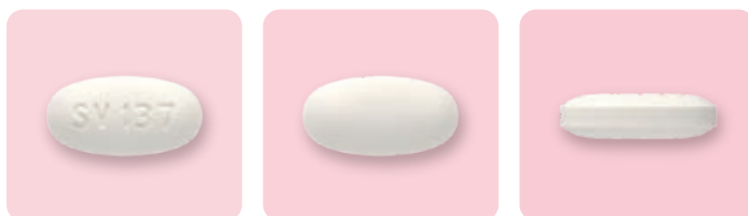
ドウベイト配合錠 (実物大)