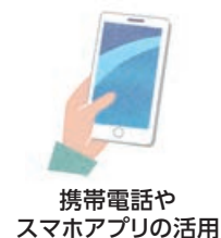
携帯電話や スマホアプリの活用